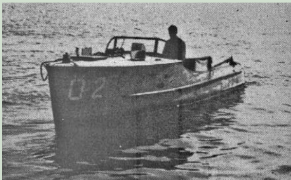
Erling Kiærs anden motorbåd, kaldet Ö 2, fotograferet efter befrielsen.