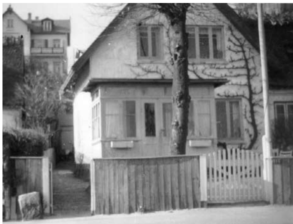
Foto af Strandvejen 144 fra 1955.