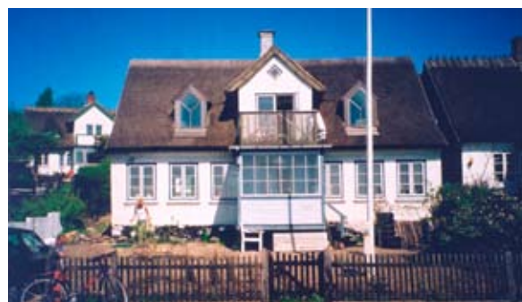
Navnet er nu pillet ned af facaden, foto maj 2001.