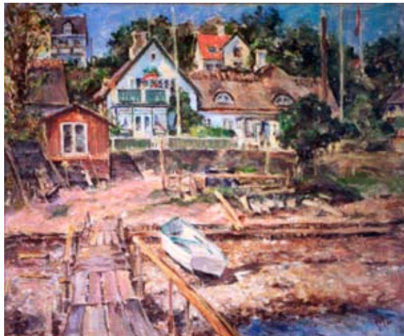
Dette billede, malt af den lokale barbermester Einar Ploug i 1960, viser ikke blot ejendommen, men også fiskernes arbejdsplads på stranden ud for huset. (Maleri i privateje).