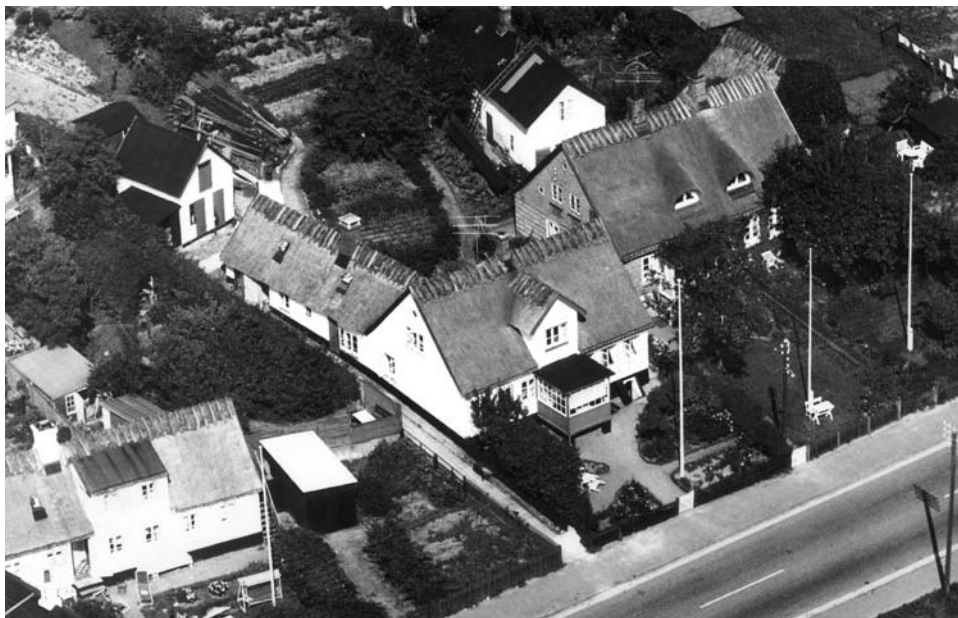
"Peters Minde" fotograferet i 1950'erne.