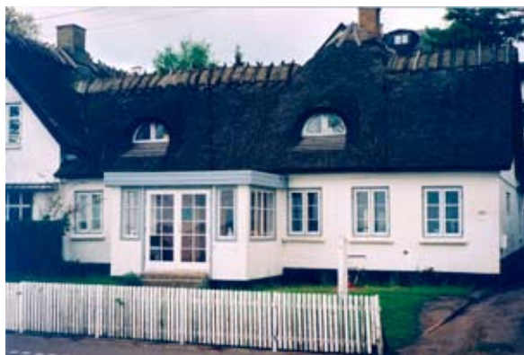
Strandvejen 142, foto maj 2001.