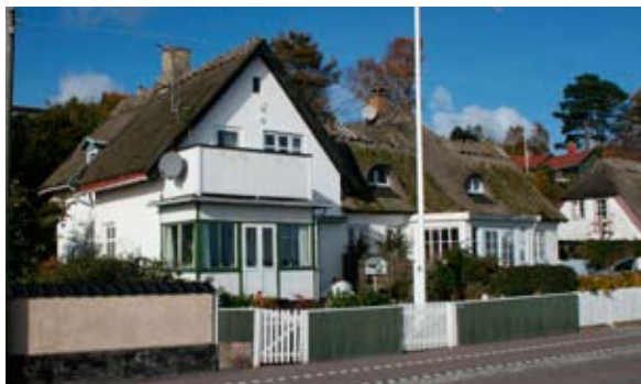
Strandvejen 144 og 142, foto oktober 2008.