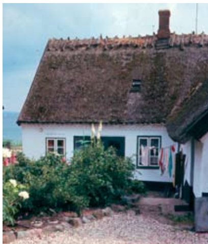
"Peters Minde" set fra "bagsiden" omkring 1970.